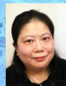
ハ短調 K. 457 北島 稚