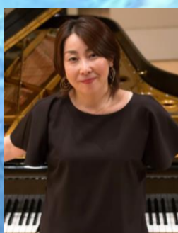
ハ長調 K. 533, 494 稲岡 千架