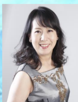
ニ長調 K. 576 米川 幸余