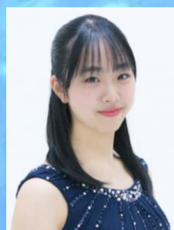
ト長調 K. 283 磯田 小波