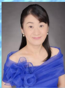
ハ長調 K. 280 赤塚 由紀