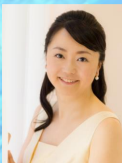
ハ長調 K. 309 後藤 泉